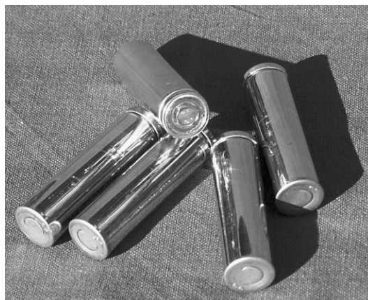
de oplaadbare batterijen in het batterijpack