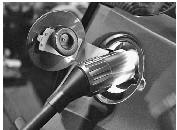
het 'bijtanken' van de auto

2p 34 De lader werkt op netspanning. De spanning die nodig is voor het opladen van het batterijpack is 375 V. Daarom zit er in de lader een transformator.